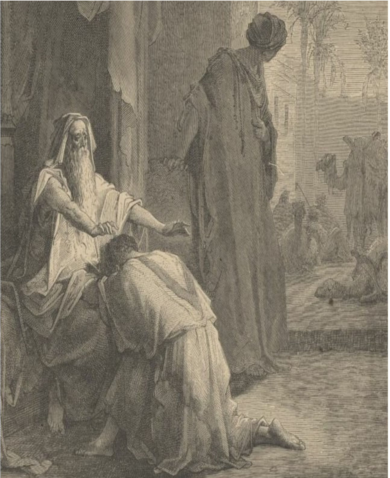
Grabado de Gustave Doré